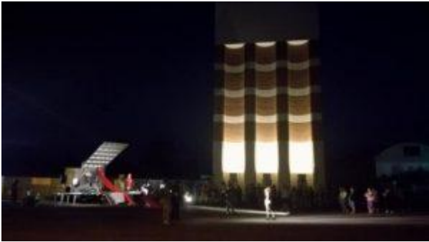
"Ascesa e caduta della Città di Mahagonny", Pontinia, 10