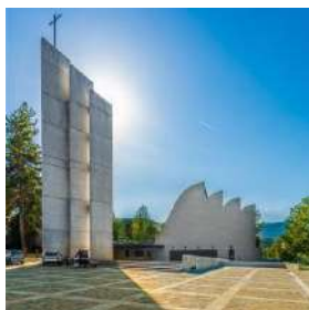
Chiesa di Santa Maria Assunta di Riola