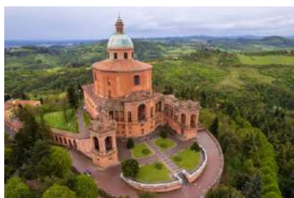
Madonna di San Luca