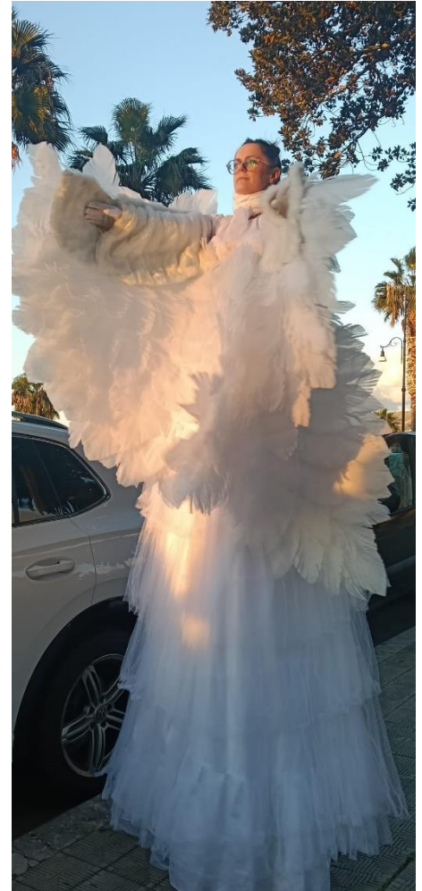
Scalinata della Giudecca, Reggio Calabria (dicembre 2025)