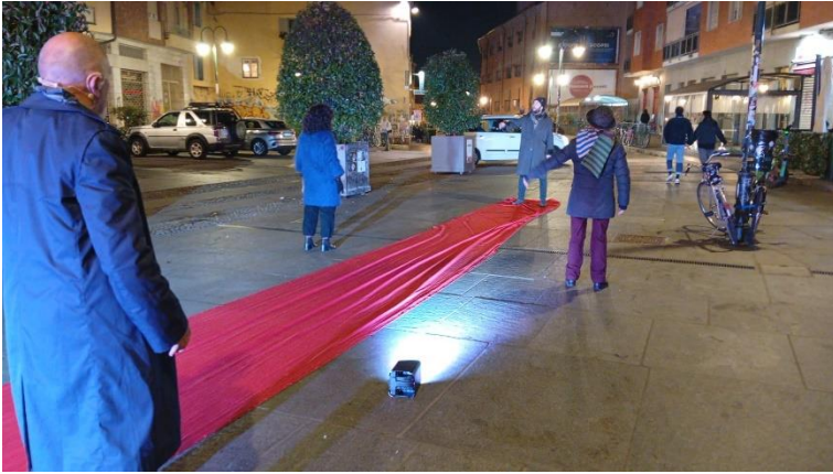
Borgo Dora, Torino (dicembre 2025)