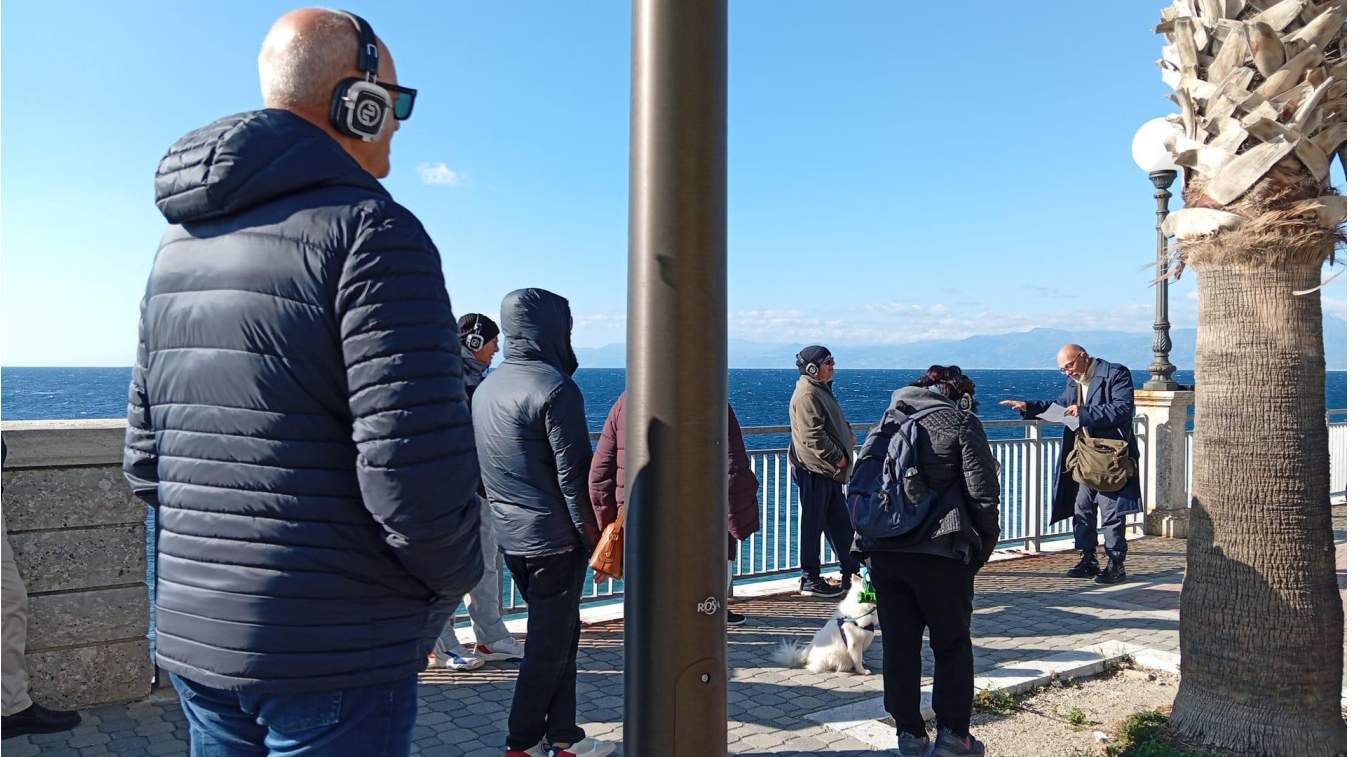
Mare di Lazzàro, Motta San Giovanni (RC) (28 dicembre 2025)