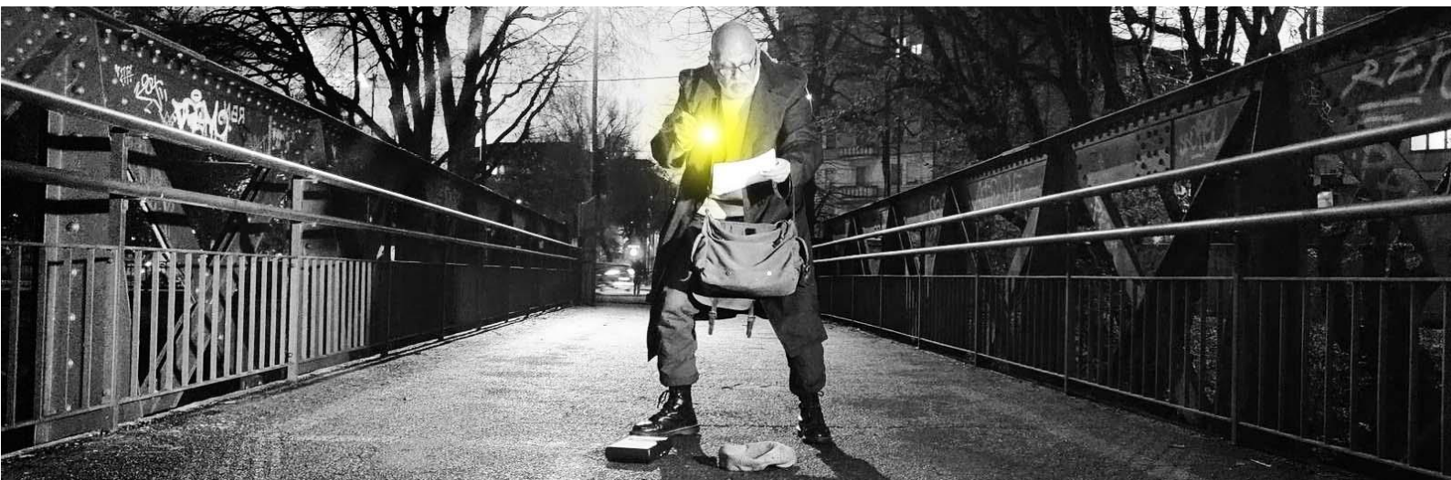
Borgo Dora, Torino (6 dicembre 2025)