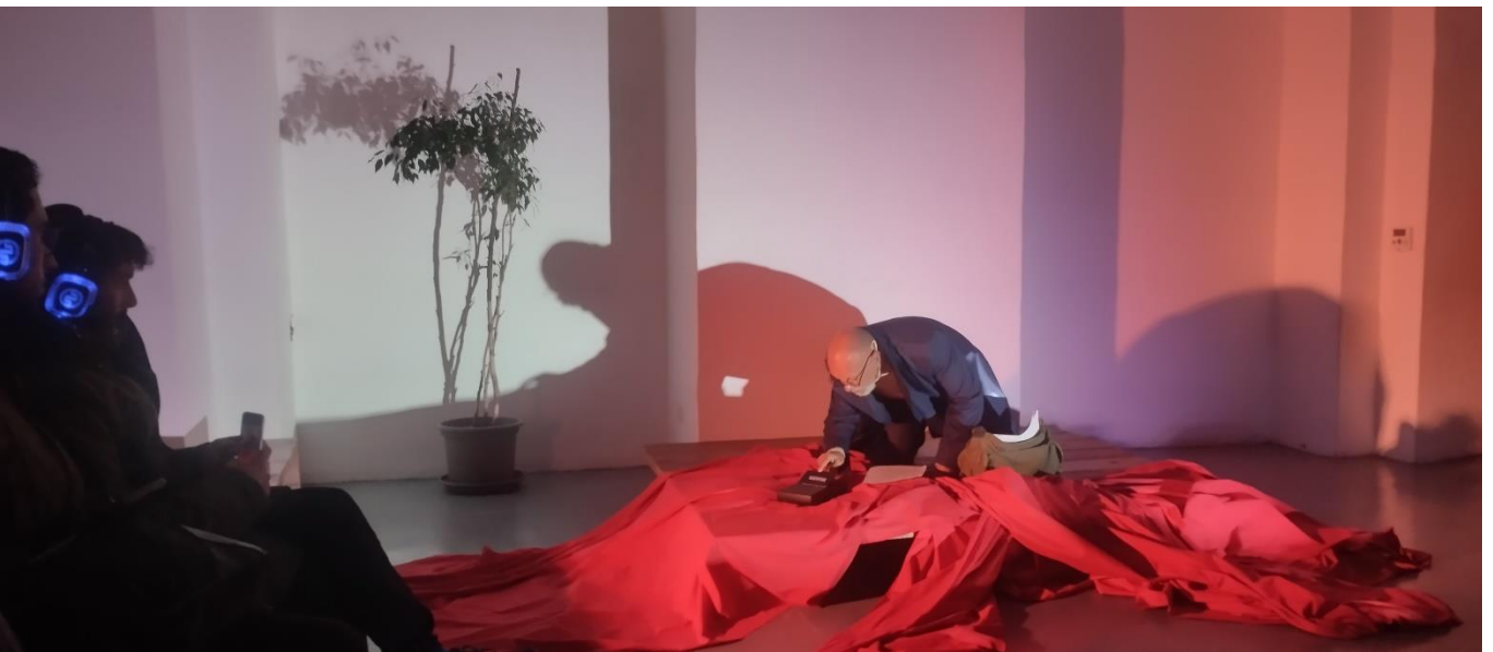
Borgo Dora, Torino (6 dicembre 2025)