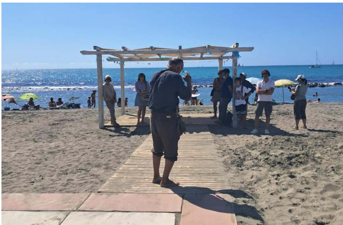
Spiaggia OCRA Ostia, Roma (13 settembre 2025)