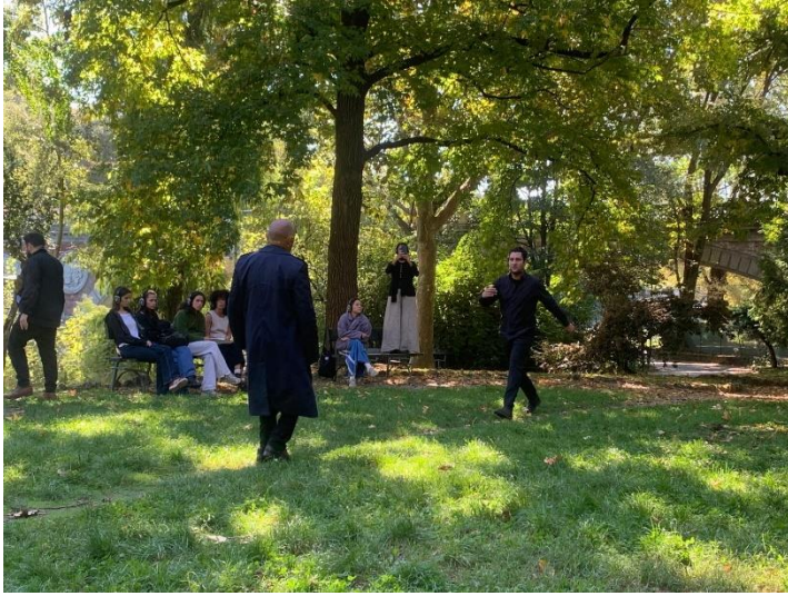
Torino (ottobre 2025)