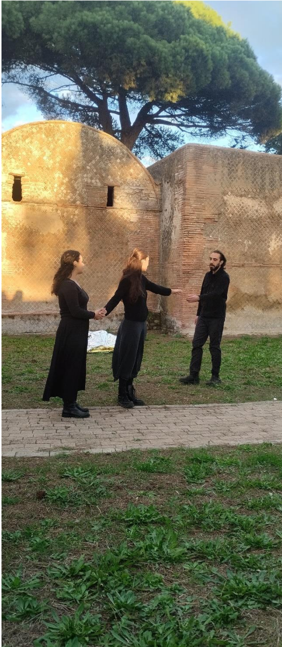
Necropoli di Porto, Fiumicino (09 novembre 2025)