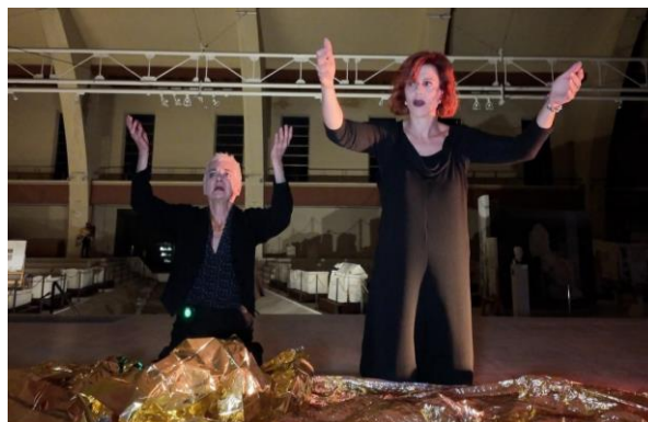
• Museo delle navi romane di Nemi, (28 settembre 2024)