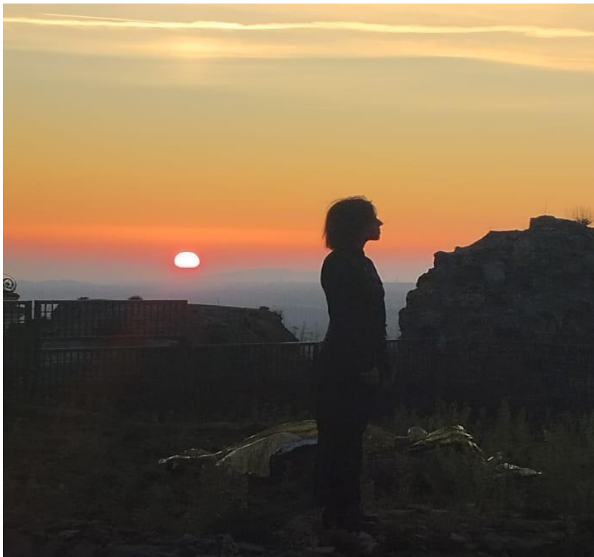
• Montefiascone Rocca dei Papi (01 novembre 2024)