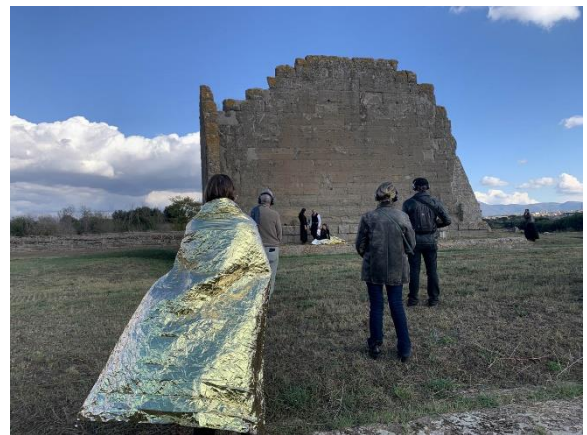
Parco Archeologico di Gabbia, (08 novembre 2025)