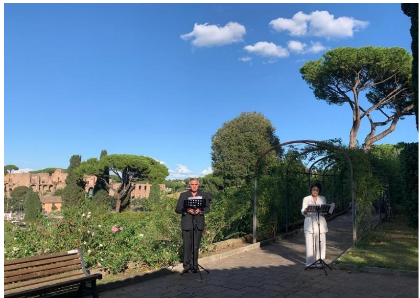
Lo stupro di Lucrezia, Roseto Comunale - Roma (29 settembre 2025)

Col tragico suicidio finale di Lucrezia, di fronte al marito Collatino e al padre di lei Lucrezio, la donna assume quindi dimensione epica, cambiando col suo gesto politico non solo la sua vita ma la storia di Roma. Infatti questo evento sarà occasione per il popolo di Roma per insorgere e cacciare per sempre la dinastia dei Tarquini dalla città che passerà da regno a repubblica.