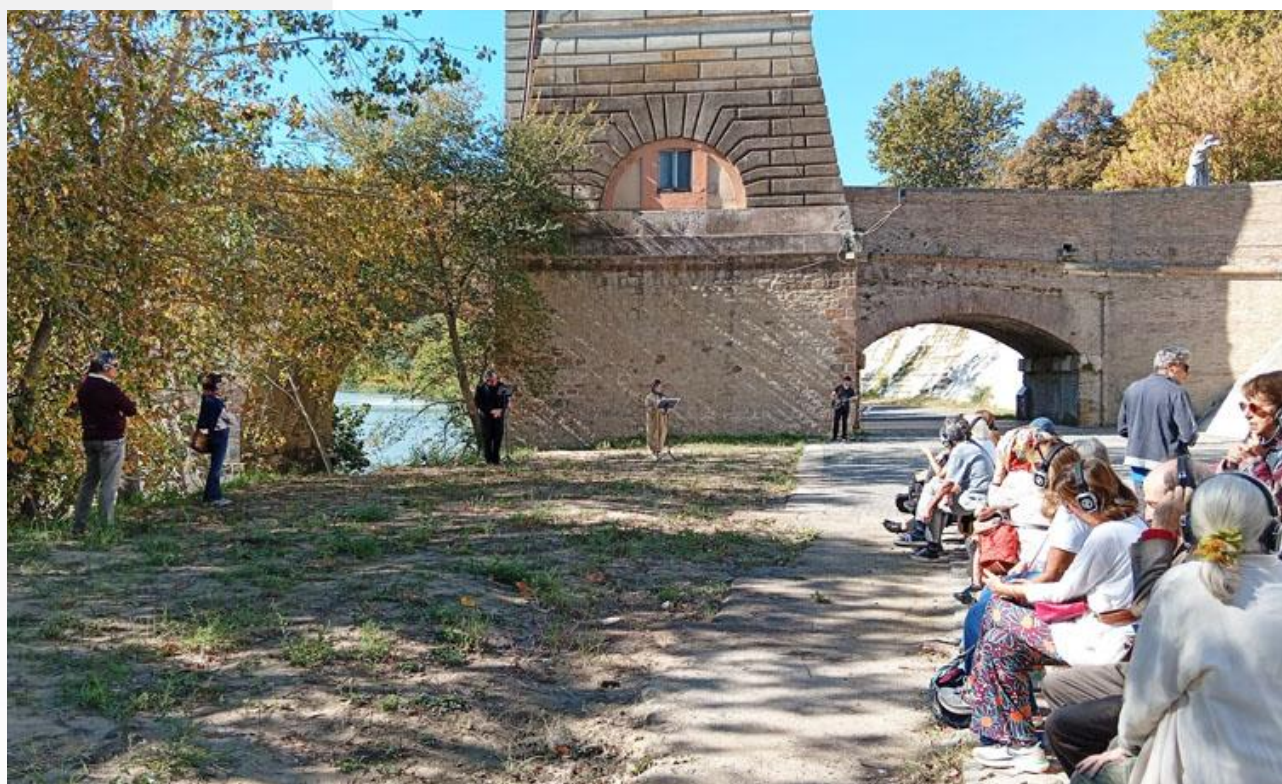
Lo stupro di Lucrezia, Ponte Milvio - Roma (11 ottobre 2025)