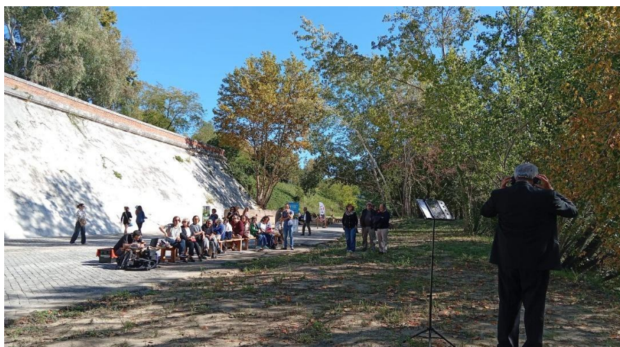
Lo stupro di Lucrezia, Ponte Milvio - Roma (11 ottobre 2025)