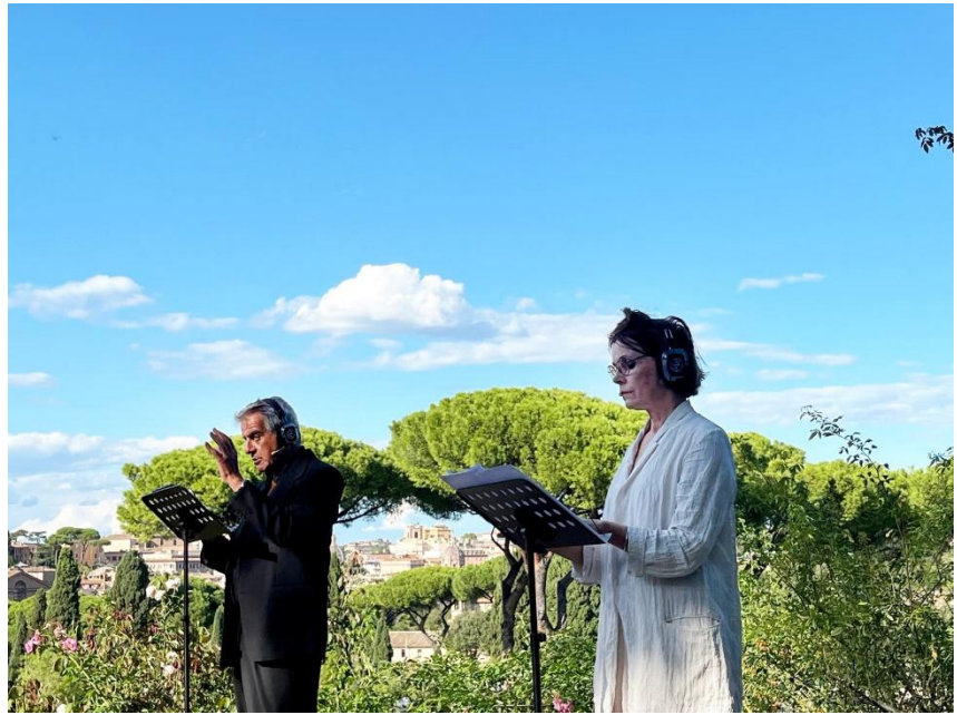
Lo stupro di Lucrezia, Roseto Comunale - Roma (27 settembre 2025)

Nei secoli la vicenda è stata oggetto di interesse per molti autori: Tito Livio, Botticelli, Benjamin Britten e altri; Artemisia Gentileschi ne ha lasciato una raffigurazione in cui l'attenzione è rivolta alla vittima, alla complessità delle sue emozioni e al suo personale modo di reagire alla violenza subita.