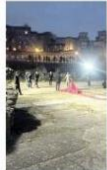
Le cave come palcoscenico

petto sorprendente, realizzato con cinque file di ombrelli allegri e colorati che, sospesi nel vuoto, collegano piazza Indipendenza, dominata dalla bellezza del ristorante Palazzo Respighi, simbolo del potere politico ed economico del Comune, con Piazza Marconi, antistante la chiesa del patrono, San Lorenzo, e l'attuale municipio, in mezzo, con la sua suggestività, via Fabiani, fiancheggiata dagli edifici storici con le comunità degli ombrelli a regalare un tocco speciale. Oltre a fornire ombra, e fresco, nelle giornate più